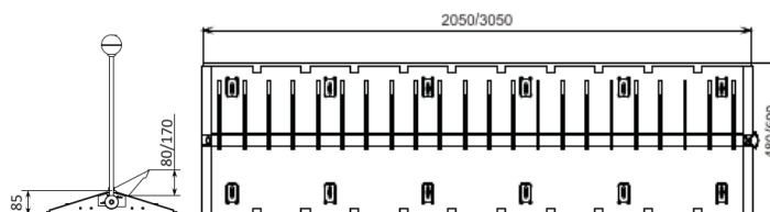
RB371 Tire Killer superficie con palanca manual